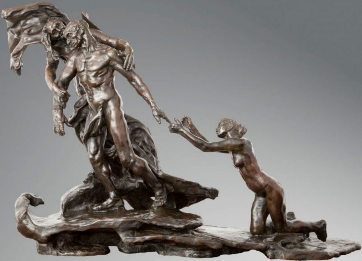
Camille CLAUDEL (1864-1943), L'Âge mur , 1898-1913, Plâtre et bronze, H. 114 ; L. 163 ; P. 72 cm, Musée d'Orsay-Musée Rodin, Paris.