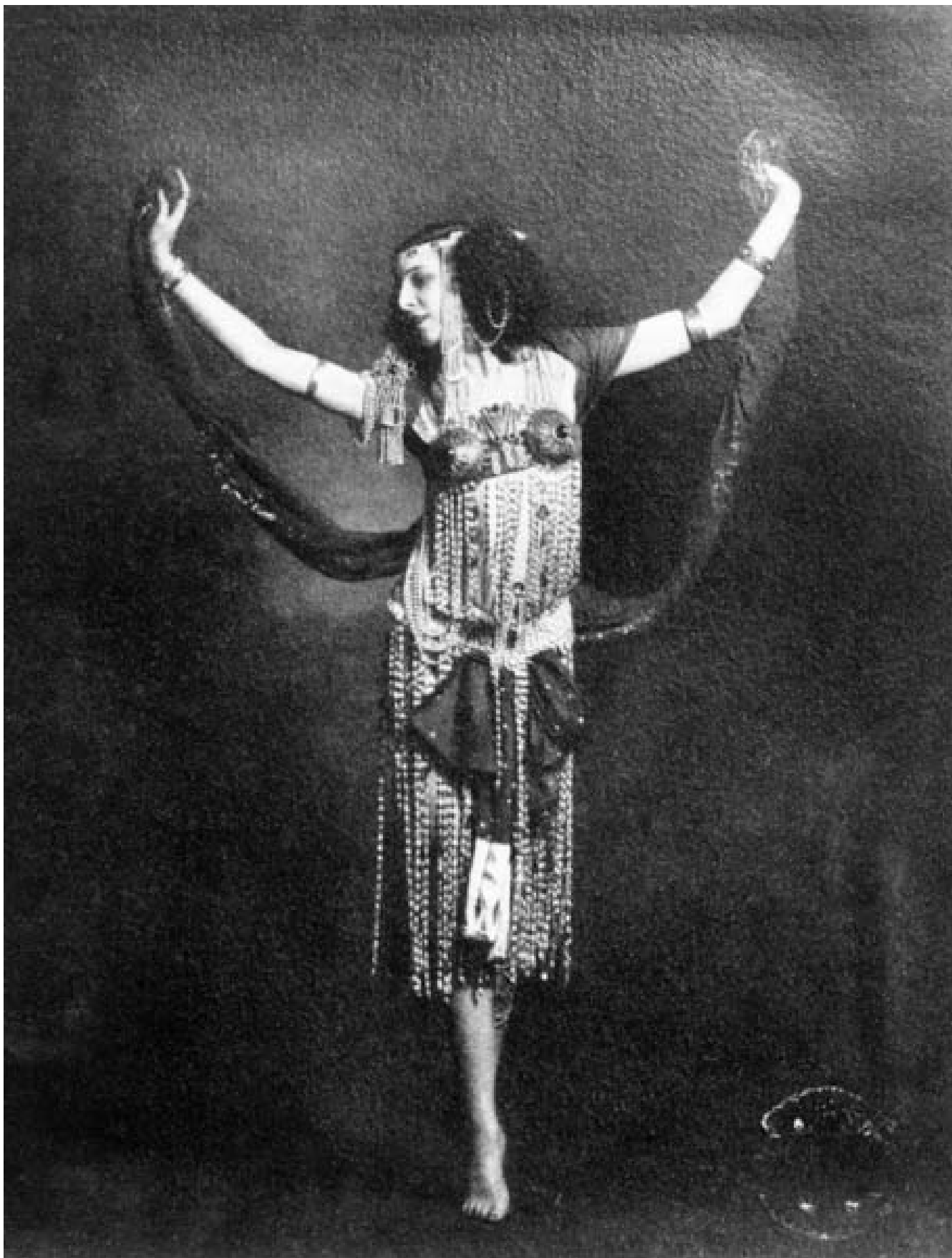
Eugène DRUET (1867-1916), Ida Rubinstein in the role of Salome, 1908