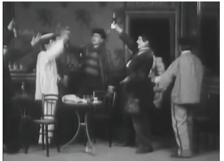
Alice GUY-BLACHÉ (1873-1968) Les résultats du féminisme , 1906 réalisation par Alice Guy-Blaché, acteurs inconnus. Extrait 5'10-6'56 ; Photogramme tiré de l'extrait.